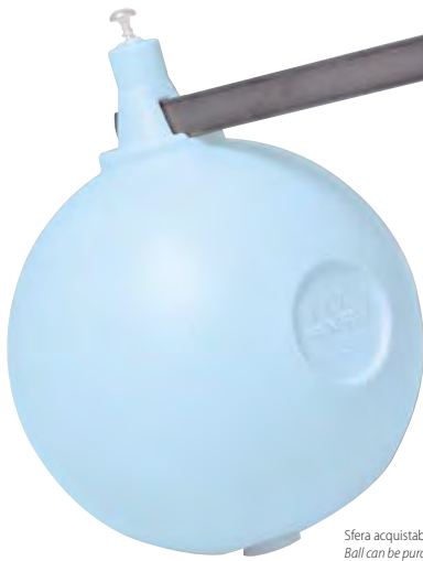
Sfera acquistabile a parte. Ball can be purchased separately.

Adjustable noiseless float valve in pressed and casting brass for high pressure equipped with inlet pipe, with flat rod.