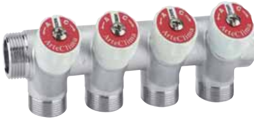
Collettore M/F 3/4" a quattro derivazioni con arresti, filetto 24x19. Attacco tubo rame, plastica e multistrato.

Manifold M/F 3/4" with four stoppers, connections for copper, plastic and multilayer pipe, thread 24x19.