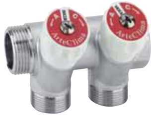
Collettore M/F 3/4" a due derivazioni con arresti, filetto 24x19. Attacco tubo rame, plastica e multistrato.

Manifold M/F 3/4" with two stoppers, connections for copper, plastic and multilayer pipe, thread 24x19.