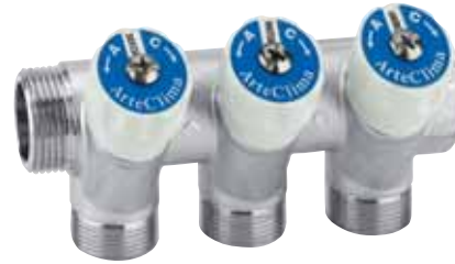
Collettore M/F 3/4" a tre derivazioni con arresti, filetto 24x19. Attacco tubo rame, plastica e multistrato.

Manifold M/F 3/4" with three stoppers, connections for copper, plastic and multilayer pipe, thread 24x19.